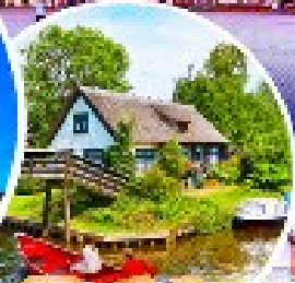
หมู่บ้านกีธูร์น