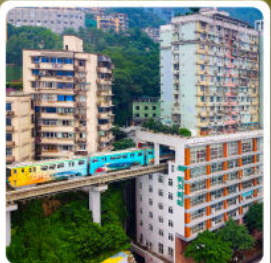
รถไฟฟ้าทะลุтик