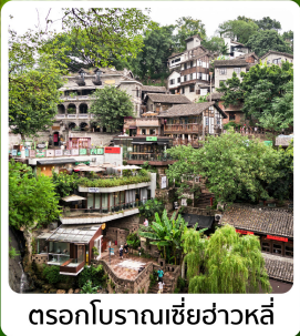
ตรอกโบราณเขี่ยฮ่าวหลี่