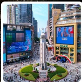
ถนนเจียฟางเป่ย์