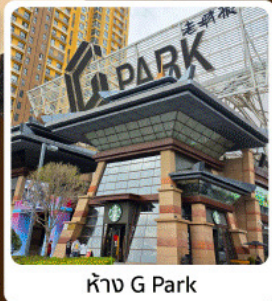
ห้าง G Park