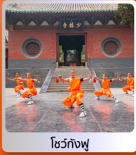
โชว์กังฟู

อาหารมือพิเศษ บุฟเฟ่ต์ สุกี่หม้อไฟ เปิดปิกกิ้งซีอาน