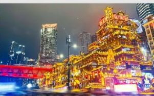
หงหยาดัง(ชมไฟยามค่ำคืน)

*ทางบริษัทฯ ขอสงวนสิทธิ์ในการสลับโปรแกรมทัวร์ตามความเหมาะสมขึ้นอยู่กับสถานการณ์หน้างาน โดยคำนึงถึงผลประโยชน์ของลูกค้าเป็นสำคัญ