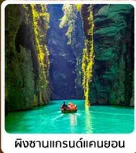
ผังชานแกรนด์แคนยอน