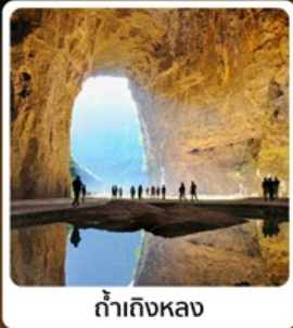
ถ้ำถึงหลวง