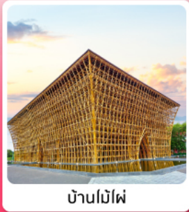
บ้านไม้ไฟ