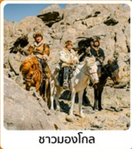
ชามองโกเลีย