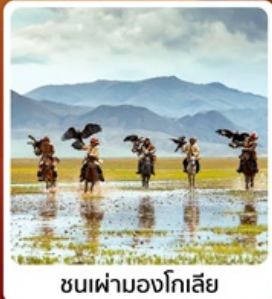
ชนเผ่ามองโกเลีย