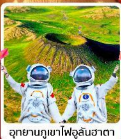
อุทยานภูเขาไฟอุลันฮาตา