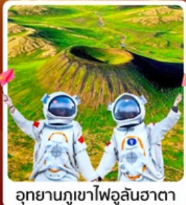
อุทยานภูเขาไฟอุลันฮาตา