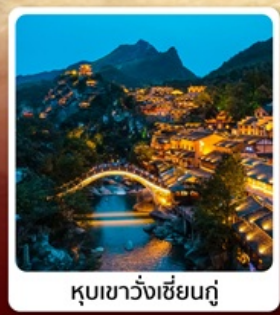
คุบเขาวังเซียนกู่