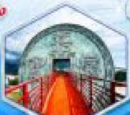
เขตกินซานหลี่