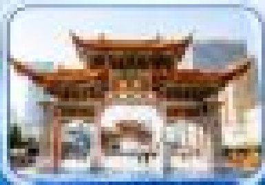
เมืองคุนหมิงโบราณ