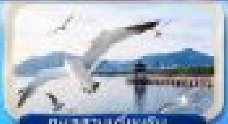
ทะเลสาบฮุ่ยเจ้อ