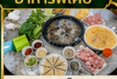
ชาบูเห็ด