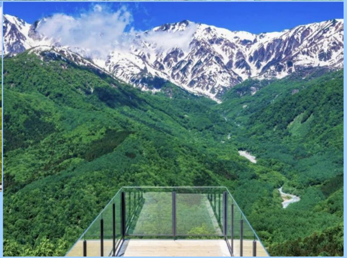
HAKUBA MOUNTAIN HARBOR THE CITY BAKERY