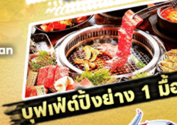
บุฟเฟต์ปิ้งย่าง 1 มื้อ

29,919 ราคา เที่ยว รวมภาษีมูลค่าเพิ่ม 7% บาท