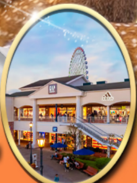
Rinku Premium Outlets