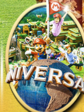
อิสระเลือกซื้อบัตร Universal Studios Japan