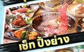
เซ็ท ซิงย่าง