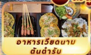
อาหารเวียดนาม ต้นตำรับ