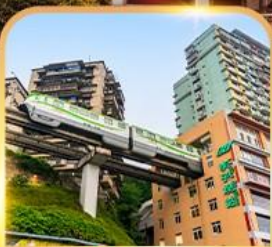
รถไฟฟ้าลูตึก