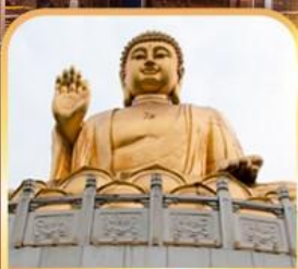
วัดหัวเหยียน