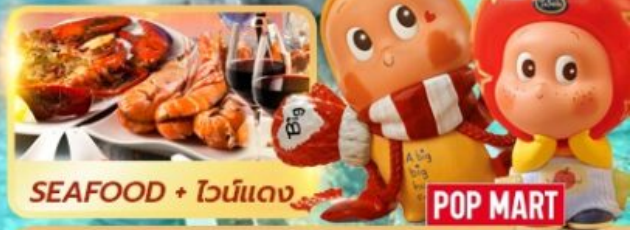
SEAFOOD + ไวน์แดง