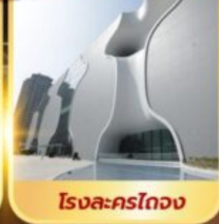
โรงละครโดง