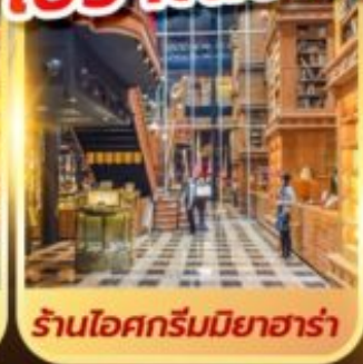
ร้านไอศกรีมมียาฮารา