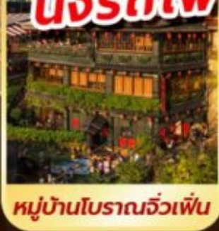
หมู่บ้านโบราณฉิวเฟิ่น