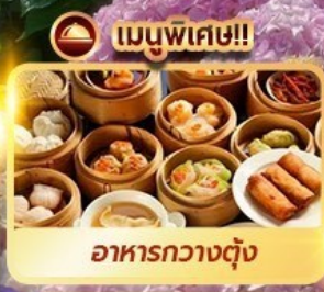
เมนูพิเศษ!! อาหารกวางตุ้ง