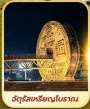
จัตุรัสเหรียญโบราณ