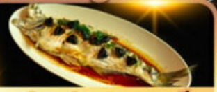
ปลาประรานาบดี