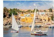
Option ล่องเรือเฟลกะ หรือ ล่องเรือชมหมู่บ้าน Nubian Village

** พักที่ Royal Beau Rivage Nile cruise 5* หรือเทียบเท่า **