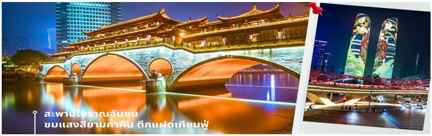
สะพานโบราณอันชุน ชมแสงสียามค่ำสิน ดึกแฝดเทียนฟู

นำท่านชม สะพานโบราณอันชุน-พร้อมชมแสงสียามค่ำสิน ดึกแฝดเทียนฟู เป็นสะพานข้ามคลองที่สร้างเป็นเหมือนอาคารอยู่ข้างบน ในช่วงเวลายามเย็นจะเป็นช่วงที่ผู้คนออกมาชมบรรยากาศบริเวณของสะพานแห่งนี้ และมีร้านค้ามากมาย รวมไปถึงบาร์เครื่องดื่มต่างๆ ที่ดึงดูดนักท่องเที่ยวได้เป็นอย่างดี เป็นสะพานที่ทอดข้ามแม่น้ำจินเจียง และเป็นรูปแบบสะพานมีหลังคา ตามลักษณะสถาปัตยกรรมจีนโบราณ อายุมากกว่า 300 ปี และในบริเวณใกล้เคียงยังเป็นที่ตั้งของ ดึกแฝดเทียนฟู โดยในช่วงค่ำเวลา ประมาณ 19.00-22.00 น. ทั้ง 2 ดึกจะเป็นไฟ LED สวยงามโดดเด่นมาก ดึกแฝดเทียนฟู หรือที่เรียกอย่างเป็นทางการว่าตึกศูนย์การเงินนานาชาติเทียนฟู เป็นตึกกระจาที่สวยงามโดดเด่นสองตึกในย่านการเงินของเฉิงตู ดึกแต่ละตึกมีความสูง 58 ชั้นและสูงกว่า 700 ฟุต ดึกเหล่านี้โดดเด่นเป็นพิเศษด้วยภายนอกที่หุ้มด้วยไฟ LED ที่เป็นเอกลักษณ์ ซึ่งเปลี่ยนอาคารให้กลายเป็นจอภาพดิจิทัลขนาดใหญ่