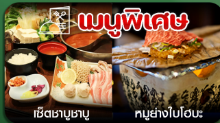
เซตซาบูซาบู