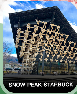
SNOW PEAK STARBUCK

คอนเฟิร์ม ออกเดินทาง ทุกพีเรียด 2 ท่านขึ้นไป