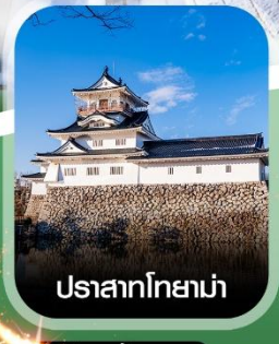
ปราสาทโทยาม่า