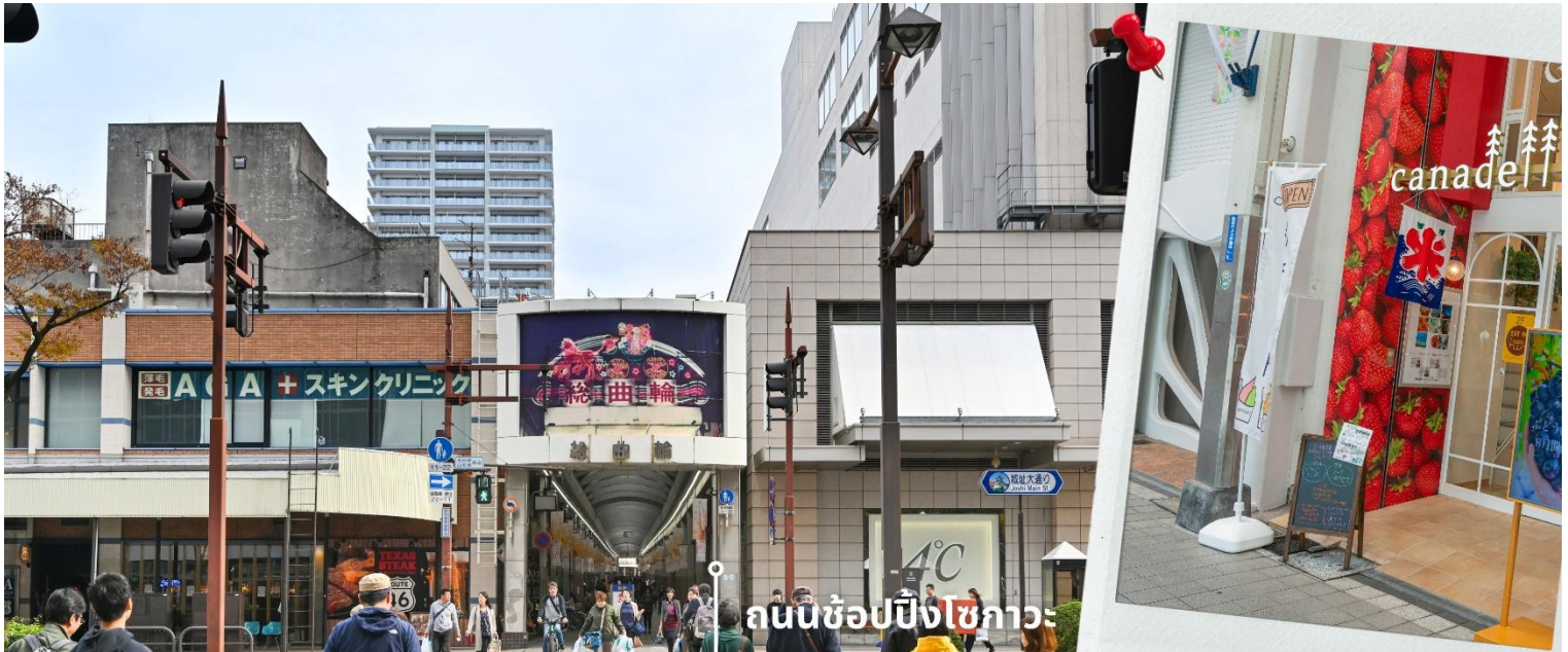
ถนนช้อปปิ้งโซกาะ

ท้องถนนและคาเฟ่สุดชิค ให้ท่านได้เพลิดเพลินกับการเลือกซื้อของฝากคุณภาพดีและสัมผัสไลฟ์สไตล์ของชาวเมืองอย่างใกล้ชิด ท่ามกลางโครงสร้างหลังคาโดมกระจกที่โปร่งสบาย ทำให้สามารถเดินช้อปปิ้งได้อย่างสนุกสนานในทุกสภาพอากาศ มอบประสบการณ์การพักผ่อนใจกลางเมืองที่ครบครันทั้งความบันเทิงและความสะดวกสบาย