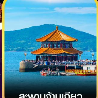
สะพานจันเฉียว