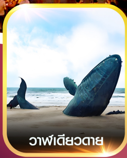
วาฬเดี่ยวตาย