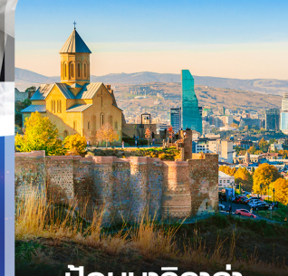
ป้อมนารีกาล่า