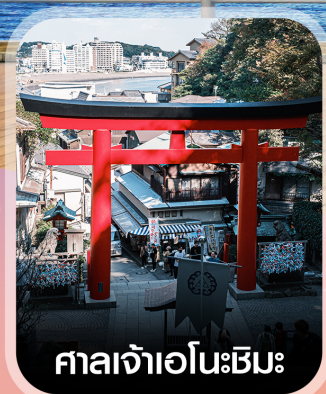
ศาลเจ้าเอโนะชิมะ