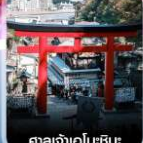
ศาลเจ้าเอโนะชิมะ