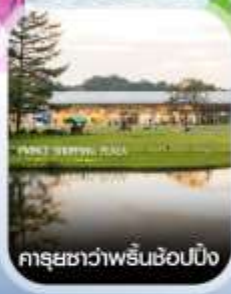
คารุชิวาว่าพรีนซ์ช้อปปิ้ง