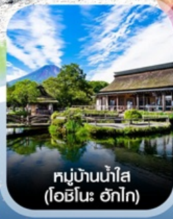
หมู่บ้านน้ำใส (โฮชิโนะ อักโก)

✈️ คอนเฟิร์มออกเดินทาง ทุกพีเรียด 2 ท่านขึ้นไป