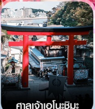
ศาลเจ้าอินะชิมะ