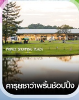
คารุชิวาว่าพรีมช้อปปิ้ง