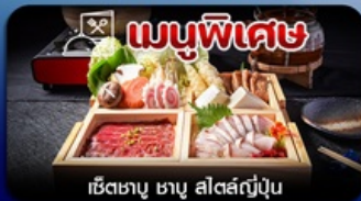
เช็ตซาบู ซาบู สีสต์ญี่ปุ่น

โตเกียว-ฟูจิ-คามิโคจิ-ทะเลสาบคาวากุจิโกะ-หมู่บ้านน้ำใส-เมืองเก่าคาวาโกเอะ-คารุชิวาว่า-อีสระช้อปปิ้งเต็มวัน