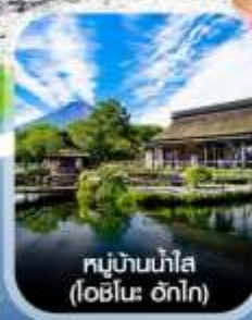
หมู่บ้านน้ำใส (โอชิโนะ ฮักไก)