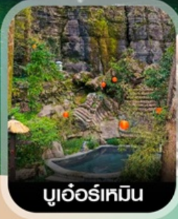
บูเออร์เหมิน