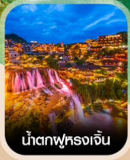
น้ำตกพุทธรังเจิน

สัมผัสสายหมอกแห่งขุนเขา สะพานอ้ายจ้าย แบบพาโรนามา แช่น้ำพุร้อนกลางธรรมชาติ อุทยานป่าไม้บูเออร์เหมิน ชมความอลังการ น้ำตกพันปี หมู่บ้านโบราณผู่หลงเจิน