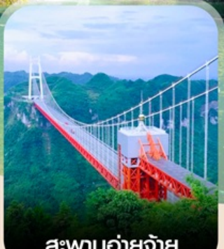
สะพานอ้ายจ้าย