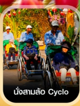
นั่งสามล้อ Cyclo