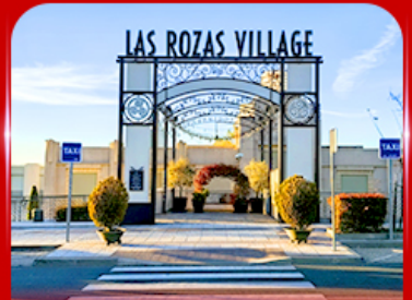
Las Rozas Village เอากีเลียน