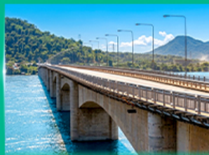
สะพานมิตรภาพลาว - ญี่ปุ่น