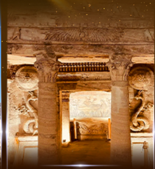
สุสานใต้ดินอเล็กซานเดรีย