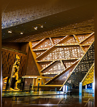
พิพิธภัณฑ์แกรนด์อียิปต์ (GEM)