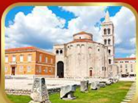
โบสถ์เซนต์โทมัส ซาตาร์