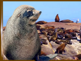
ส่องเรื่องซนฝูงเมวน้ำ Seal Island