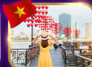
เข็มนาฬิกาแห่งความรัก