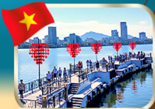
เช็คอินสะพานแห่งความรัก ดานัง