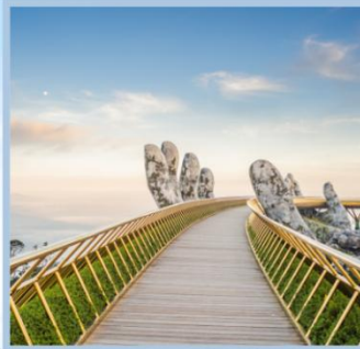
สะพานมือทองคำ