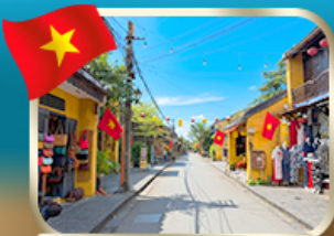
เที่ยวชมเมืองเก่ามรดกโลก ฮอยอัน