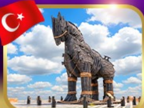
ม้าไม้เมืองกรอย ซานักคาล์