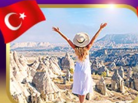
ชมความงาม หุบเขาแห่งรัก