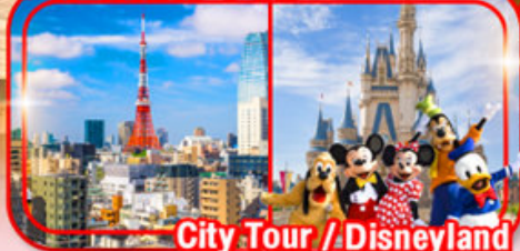
City Tour / Disneyland