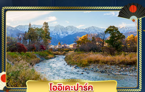
โออิเคะปาร์ค