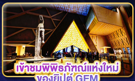
เข้าชมพิพิธภัณฑ์แห่งใหม่ ของอียิปต์ GEM