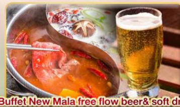
*Buffet New Mala free flow beer& soft drink