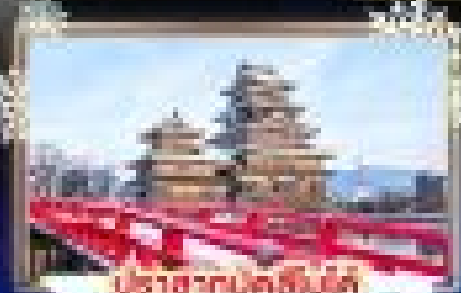
ปราสาทนินจา