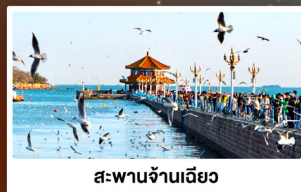
สะพานจ้านเฉียว