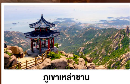
ภูเขาเหล่าซาน