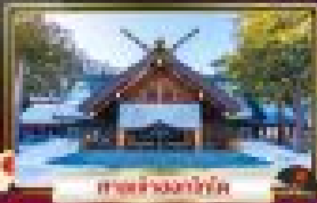
ศาลเจ้าวงกาทัง