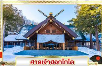
ศาลเจ้าออกโทโด