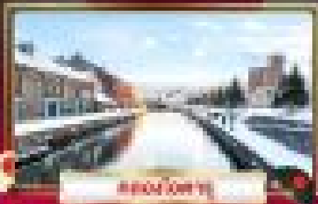
ถนนไวต์สโนว์

ฉลองเทศกาลปีใหม่ จับสโนว์โมบิลท่ามกลางหิมะ