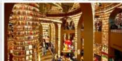
ร้านหนังสือจงซูเก๋อ

เดินทางโดย: สายการบินเฉิงตูแอร์ไลน์ (EU)