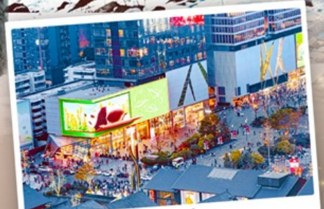
ถนนไท่กู๋หลี่หลิน