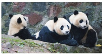
หุบเขาแพนด้า