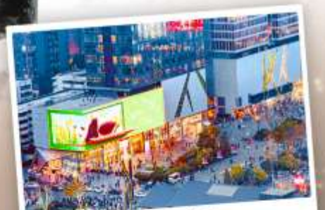
ถนนไท่กู่หลี่หลิน